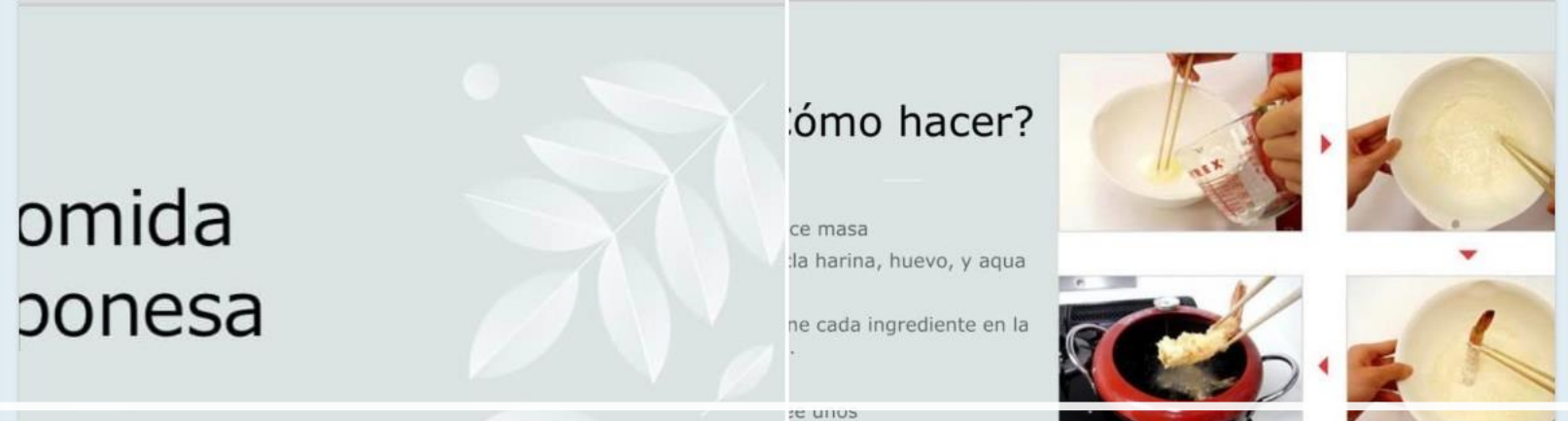
Publicación sobre platos típicos en Facebook

2022年11月20日 ¡Hola! Perdon subió tarde. Son sobre Tempura, comida japonesa. Podemos comer varios ingredientes. ¿Qué los quieres comer?